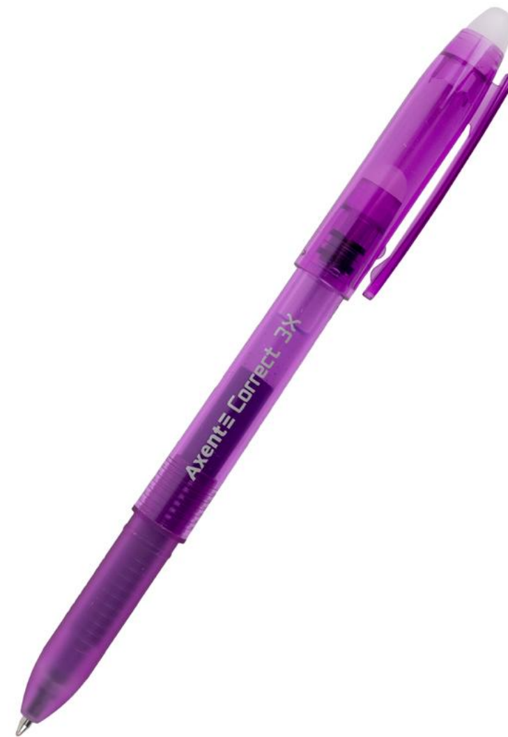
Артикул: AG1122-11-A (фіолетова)