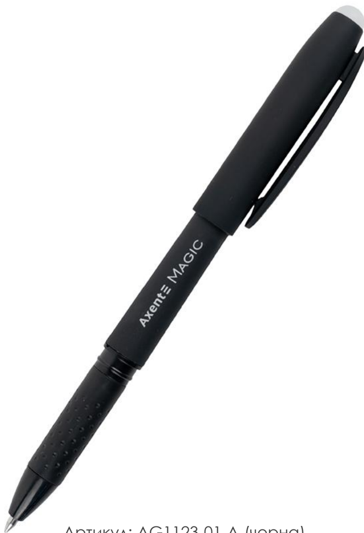
Артикул: AG1123-01-A (чорна)