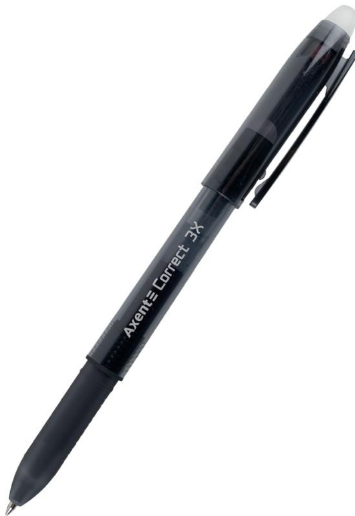
Артикул: AG1122-01-A (чорна)