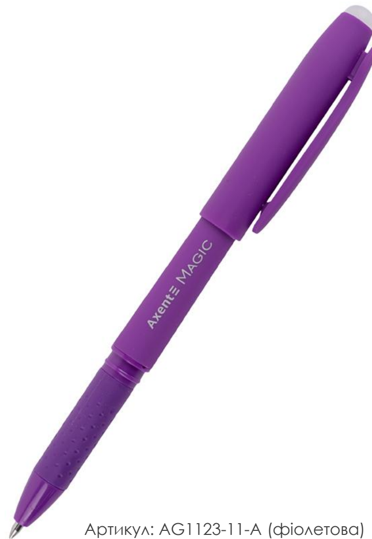
Артикул: AG1123-11-A (фіолетова)